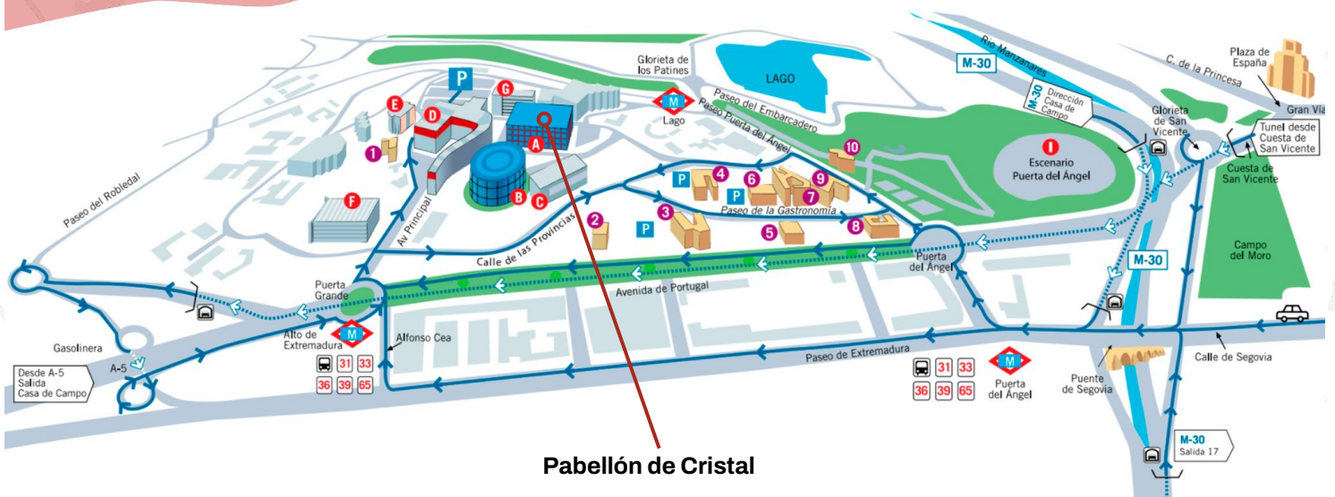
Pabellón de Cristal

Dirección: Avenida Principal, 16 – 28011. Casa de Campo (Madrid)